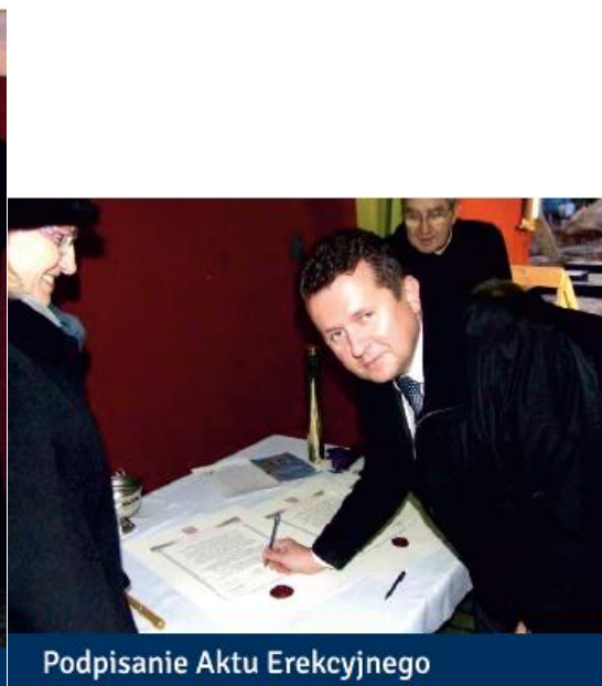
Podpisanie Aktu Erekcyjnego