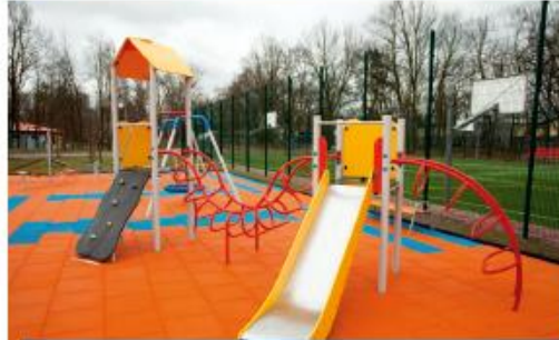
Plac zabaw w ramach programu „Radosna szkoła”