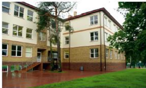
Nowy budynek Szkoły Podstawowej Nr 2