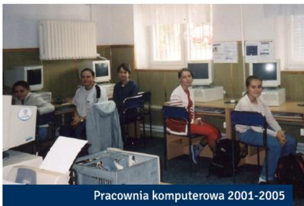
Pracownia komputerowa 2001-2005