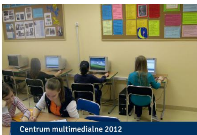
Centrum multimedialne 2012