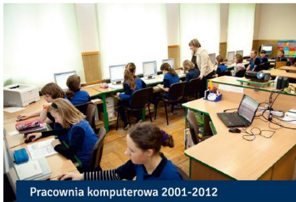
Pracownia komputerowa 2001-2012

W 2006 r. szkoła otrzymała ze środków EFS przy współpracy UE Internetowe Centrum Informacji Multimedialnej w bibliotece szkolnej oraz pracownię ze sprzętem specjalistycznym do pracy logopedycznej.