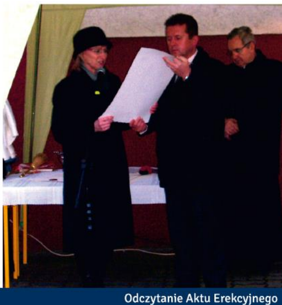
Odczytanie Aktu Erekcyjnego

Przedstawiono projekt rozbudowy szkoły, którego realizację rozpoczęto 05 listopada 2009 r. Uroczystość wmurowania Aktu Erekcyjnego miała miejsce 11 grudnia 2009 r.