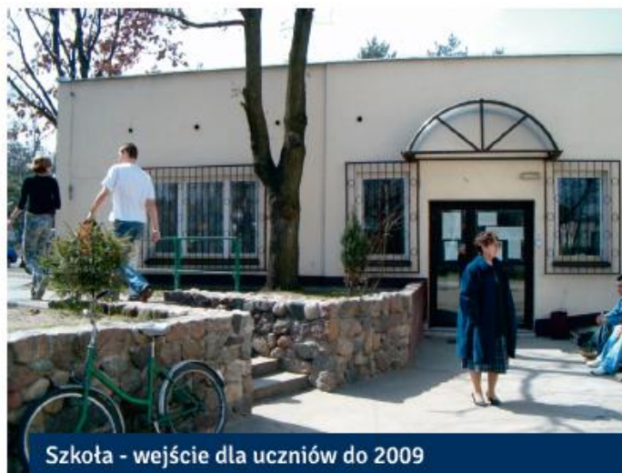
Szkoła - wejście dla uczniów do 2009