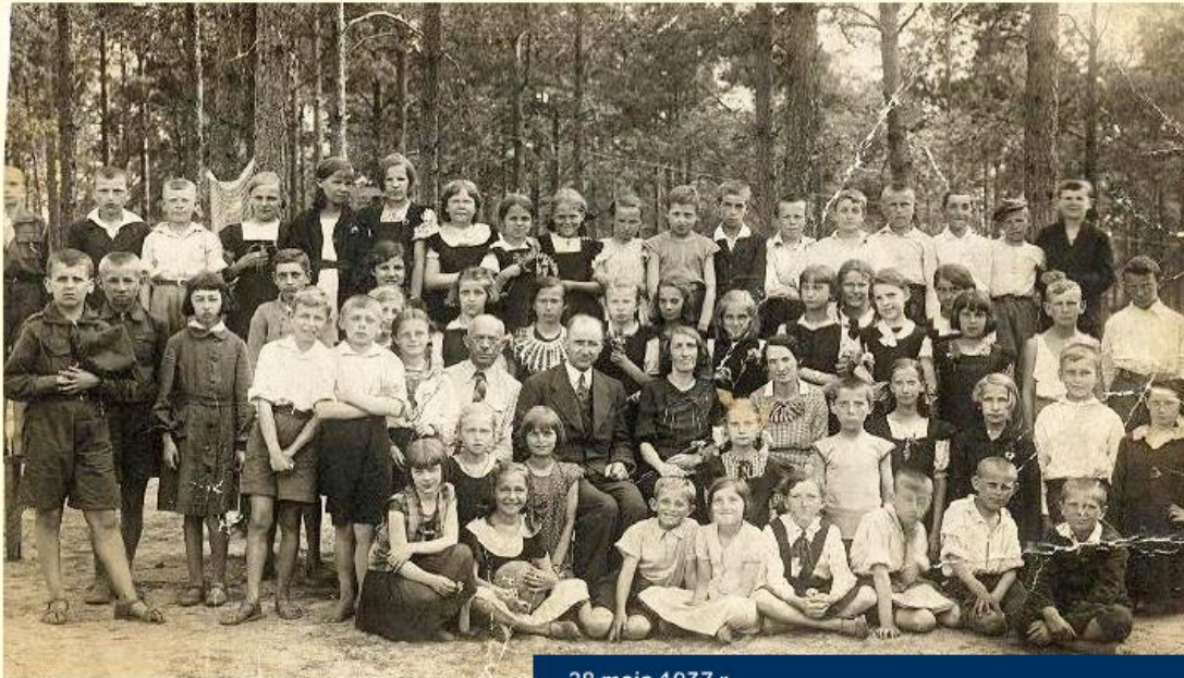
28 maja 1937 r.