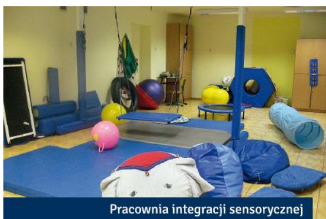
Pracownia integracji sensorycznej

W 2006 r. szkoła otrzymała ze środków EFS przy współpracy UE Internetowe Centrum Informacji Multimedialnej w bibliotece szkolnej oraz pracownię ze sprzętem specjalistycznym do pracy logopedycznej.