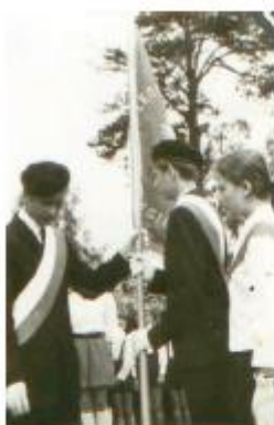
Przekazanie sztandaru 1970