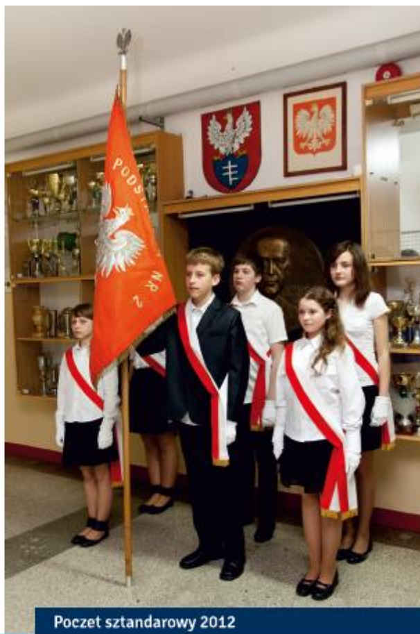
Poczet sztandarowy 2012