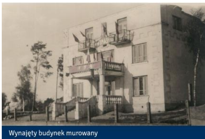
Wynajęty budynek murowany