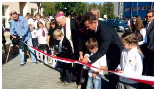
30.09.2011 - Otwarcie nowego budynku Szkoły Podstawowej Nr 2 i Przedszkola Miejskiego Nr 2