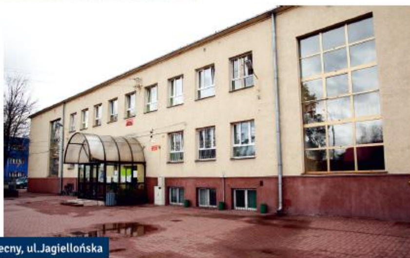
Szkoła - widok obecny, ul. Jagiellońska

706 uczniów miało wreszcie do dyspozycji salę gimnastyczną, uczyło się w widnych i ciepłych salach lekcyjnych umieszczonych na dwóch kondygnacjach. Szkoła wzbogaciła się również